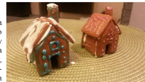
Piernikowe chatki malowane 11 grudnia

Chcemy stworzyć ofertę kulturalną dla mieszkańców Księży w należącym do spółdzielni budynku przy ulicy Tarnogórskiej 1. Pomysł na nią ma Fundacja Domek Kultury. Chcielibyśmy, żeby to mieszkańcy decydowali o programie i sami proponowali interesujące ich zajęcia. Z doświadczenia wiadomo, że ludzie bardziej się wtedy angażują. Stąd też poniższa ankieta, która pozwoli zorientować się w Państwa preferencjach. Prosimy o jej wypełnienie i pozostawienie w aptece przy ulicy Chorzowskiej. W nowo wyremontowanej sali na I piętrze odbyło się już kilka spotkań, m.in.: koncert jazzowy, spotkanie z fizyką, malowanie świątecznych pierników i piernikowych chatek oraz