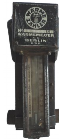
Podzielnik ciepła zdemontowany z kaloryfera mieszkania przy ulicy Opolskiej.

Zanim takie urządzenia ponownie pojawią się na naszym osiedlu konieczna