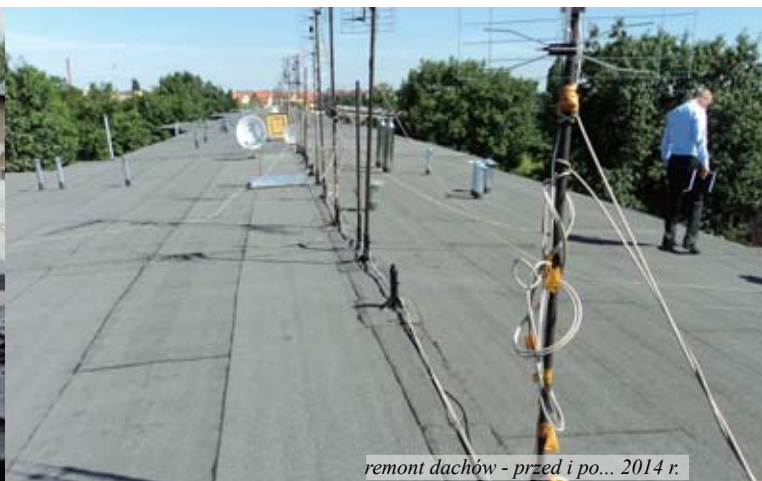
remont dachów - przed i po... 2014 r.

„Gazeta” została wydana za pomocą SM Księża Małe, komitet redakcyjny: Michalina Cieślukowska-Kulmatycka, Zofia Dillenius, Joanna Grześkowiak, opracowanie graficzne: Michalina Cieślukowska-Kulmatycka, numer złożony do druku 20 czerwca 2014 r.