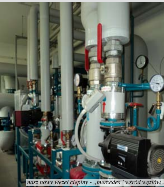
nasz nowy węzeł cieplny - „mercedes” wśród węzłów...